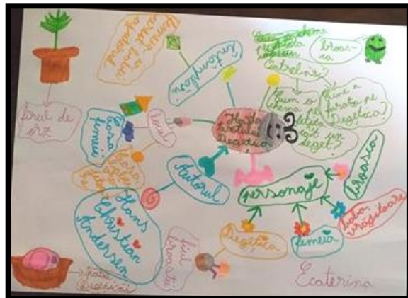
(Hărți realizate de elevi de clasa a II-a pentru lectura Degețica de H. C. Andersen)